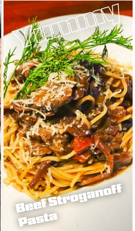
Beef Stroganoff Pasta