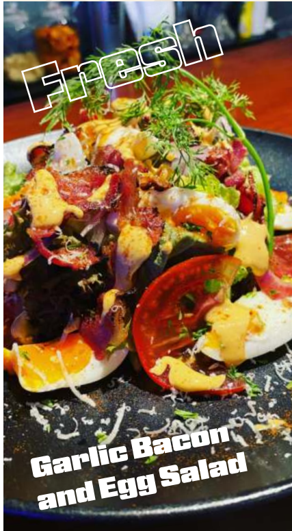
Garlic Bacon and Egg Salad

MODISでは、おいしい料理、素敵な飲み物と一緒に、最高のひと時を提供しています。