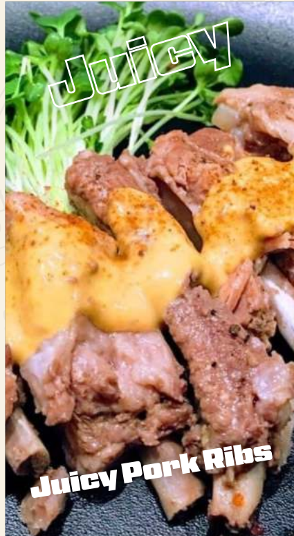
Juicy Pork Ribs