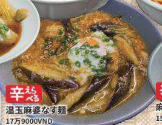
辛 超 べる