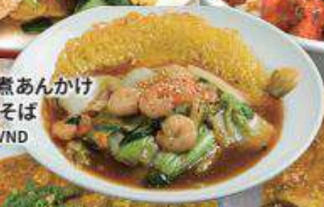
辛 超 べる