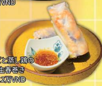
エビと蒸し鶏の 生春巻き 12万VND