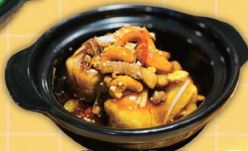
鴨と豆腐の宮保ソース 10万VND