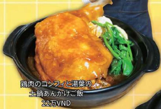
鶏肉のコンフィと湯葉の 土鍋あんかけご飯 22万VND