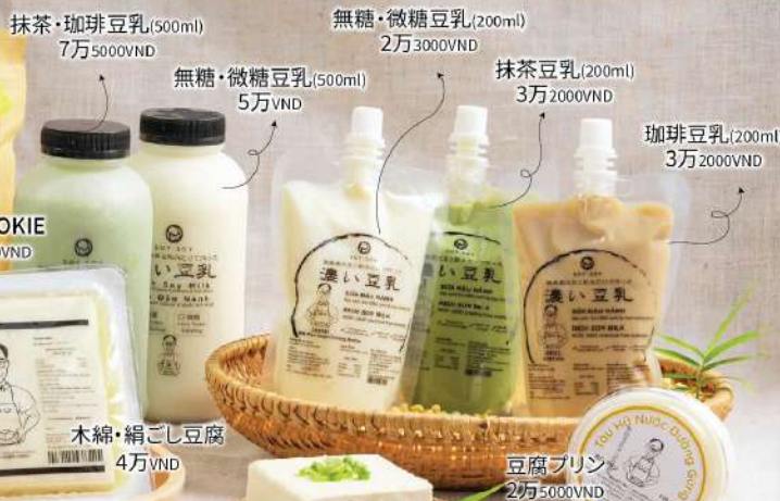
抹茶・珈琲豆乳(500ml) 7万5000VND