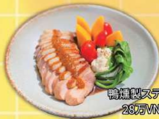
鴨燻製ステーキ 28万VND