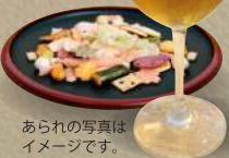
あられの写真は イメージです。