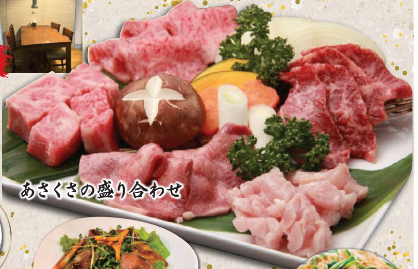
あさくさの盛り合わせ