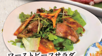
ローストビーフサラダ