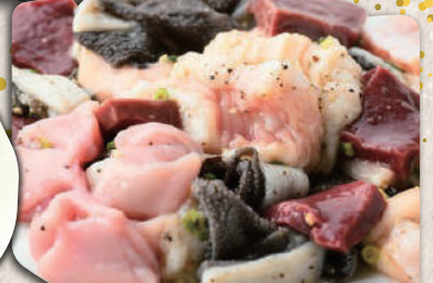
ホルモン盛り合わせ(全10種)