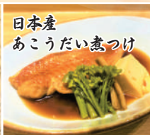
日本産 あこうだい煮つけ