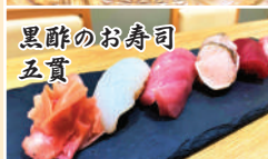
黒酢のお寿司 五貫