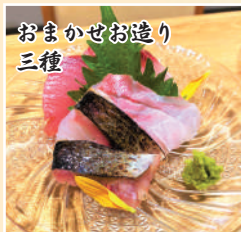
おまかせお造り 三種