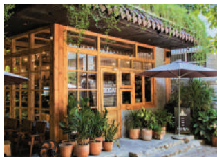
② IKIGAI Nguyen Chi Thanh