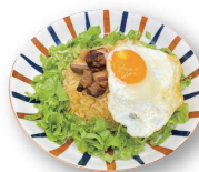
ごろごろ角煮炒飯 120.000d