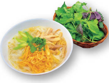
やさしい鶏のフォー 80.000d