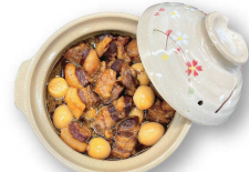
オーガニック豚の角煮 260.000d(2~3人前)