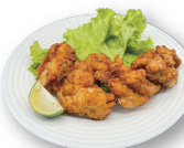
やみつきカラアゲ (4個) 95.000d