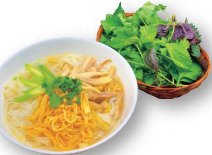
やさしい鶏のフォー 80.000d