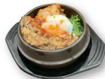
石焼(トルソップ)牛丼 155.000d