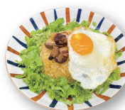
ごろごろ角煮炒飯 120.000d