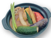
スパイシースープカレー 155.000d