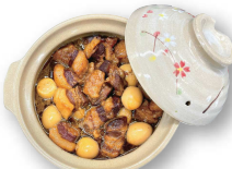
オーガニック豚の角煮 260.000d(2~3人前)