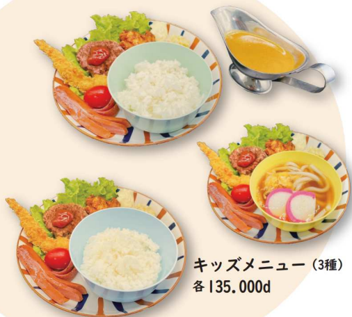
キッズメニュー (3種) 各 135.000d