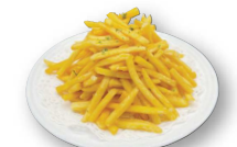
山盛りポテトフライ 85.000d