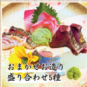
おまかせお造り 盛り合わせ5種