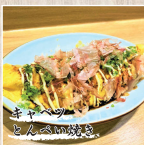
キヤベツ とんすいの焼き