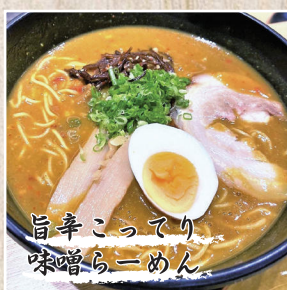
旨辛こってり 味噌らーめん