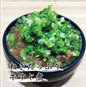
ねぎたっぷり 牛ホド煮